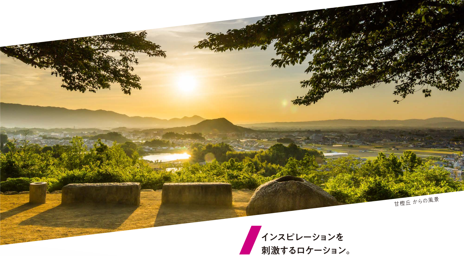
甘藷丘からの風景