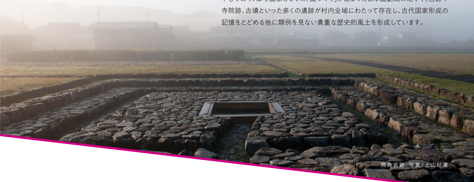
飛鳥宮跡

奈良盆地の南端に位置し、豊かな自然と人の営みが共存する“里山の暮らし”を 今に伝える明日香村。約1,400年前の飛鳥時代に都が築かれた政治や文化の 中心であり、律令国家としての「国づくり」が始まった日本国創成の地です。宮跡や 寺院跡、古墳といった多くの遺跡が村内全域にわたって存在し、古代国家形成の 記憶をとどめる他に類例を見ない貴重な歴史的風土を形成しています。